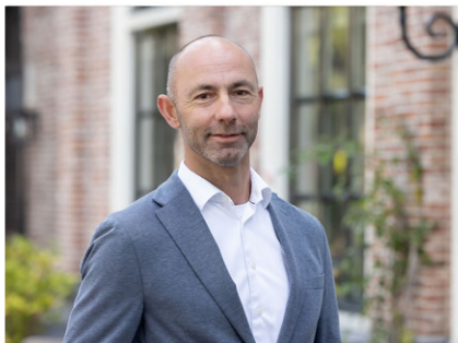
NVM Makelaar-Taxateur o.z.

Omdat we de kracht en kennis in huis hebben