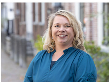
Commerciële binnendienst medewerkster