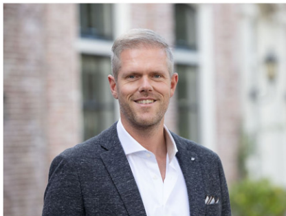
NVM Makelaar-Taxateur o.z.