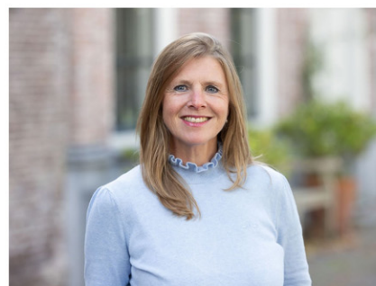
Commerciële binnendienst medewerkster