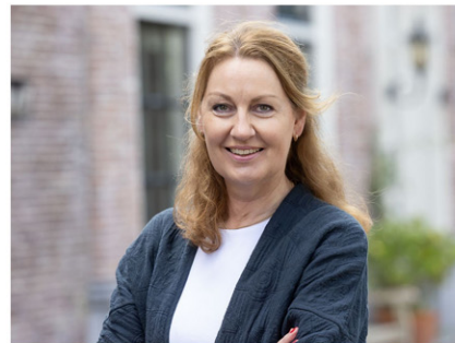
NVM Makelaar-Taxateur o.z.