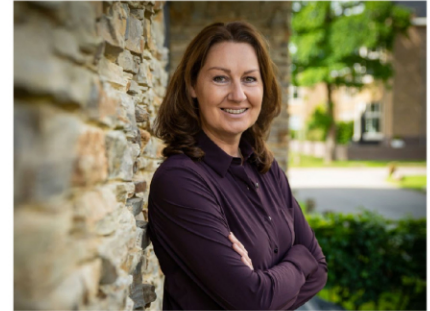
NVM Makelaar-Taxateur o.z.