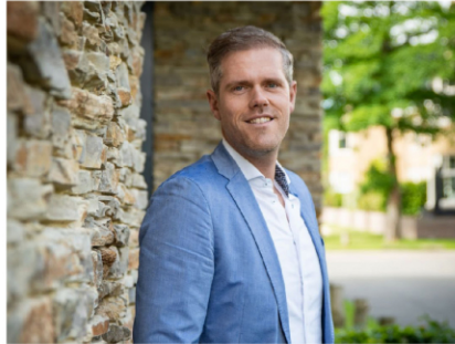
NVM Makelaar-Taxateur o.z.