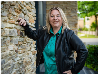
Commerciële binnendienst medewerkster