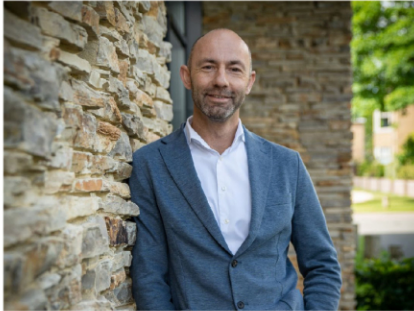
NVM Makelaar-Taxateur o.z.

Omdat we de kracht en kennis in huis hebben